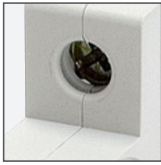
zaciski/šruby ze stali ocynkowanej