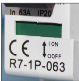
kontrolka sygnalizująca zadziałanie